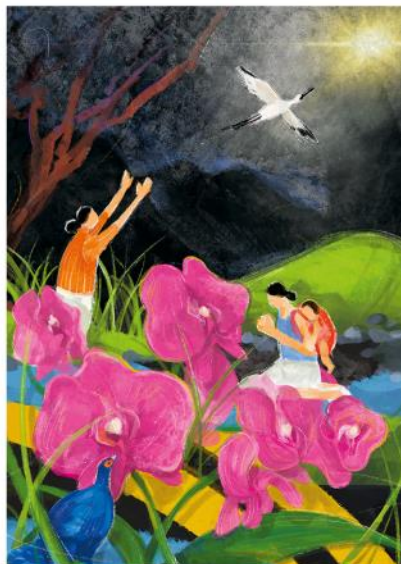
Das Titelbild zum Weltgebetstag 2023 stammt von der Künstlerin Hui-Wen Hsiao. Die Frauen auf dem Gemälde sitzen an einem Bach, beten still und blicken in die Dunkelheit. Trotz der Ungewissheit des Weges, der vor ihnen liegt, wissen sie, dass die Rettung durch Christus gekommen ist.

Über Länder- und Konfessionsgrenzen hinweg engagieren sich Frauen seit über 100 Jahren für den Weltgebetstag.