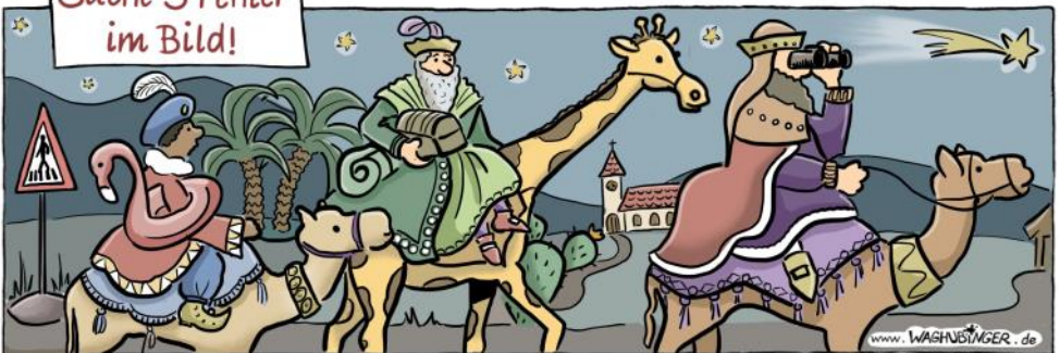
Strassenschild, Flamingo, Giraffe, Kirche, Fernglas